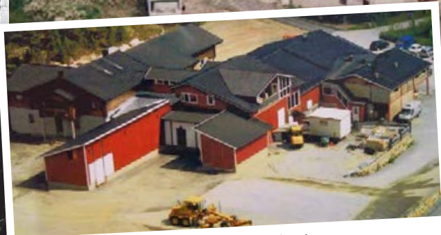
2008 Lappi, Satakunta