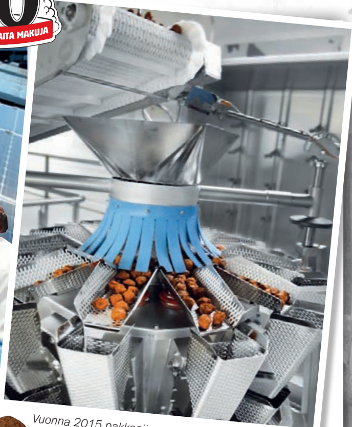
Vuonna 2015 pakkaajien avuksi saatu monipäävaaka

Lihapullien tuotannossa hyödynnämme aurinkovoimaa!