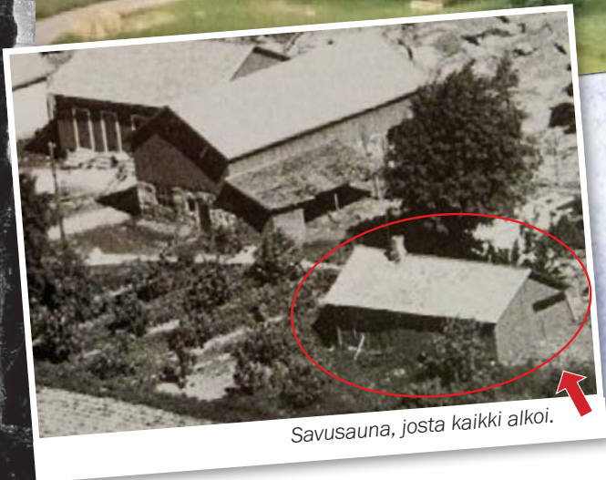
Savusauna, josta kaikki alkoi.