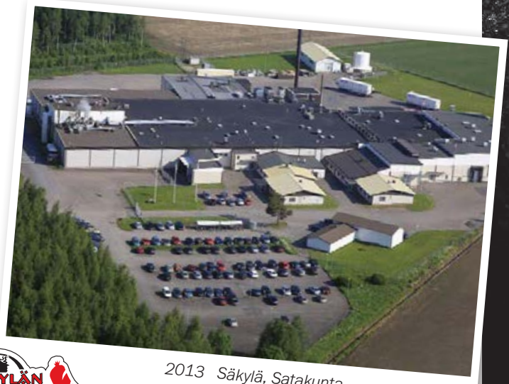
2013 Säkylä, Satakunta

Kivikylän Kotipalvaamo palkkasi ensimmäisen ulkopuolisen työntekijänsä vuonna 1995. Tällä hetkellä työntekijöitä on reippaasti päälle 350:n. Vaikka toiminta on laajentunut, on tuotannossa pyritty säilyttämään alkuperäistä käsityön leimaa mahdollisimman paljon. Palviliha