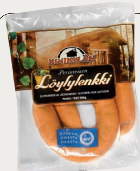
LÖYLYLENKKI 400 G