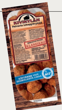
PALVARIN LIHAPYÖRYKÄT 350 G