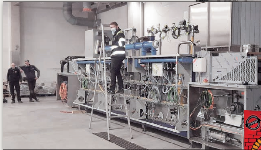
Pizzalinjasto keväällä rakennusvaiheessa.

Pizzojen maailma on kilpailtu, mutta kotimaisuudella on rivissä paikkansa. Kun Kivikylän linjasto pyörii täysillä kahdessa