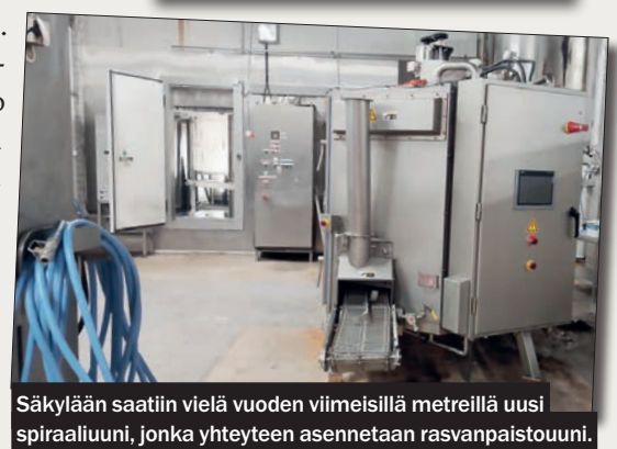
Säkylään saatiin vielä vuoden viimeisillä metreillä uusi spiraaliuuni, jonka yhteyteen asennetaan rasvapaistouuni.