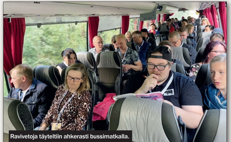
Ravivetoja täyteltiin ahkerasti bussimatalla. Kimppavedon tuloksiin ei kannata sen enempää palata. - Laihat tulokset - kaikki! Kuvassa Kivikylän possutuottaja.