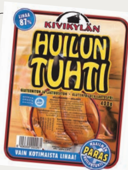
HUILUNTUHTI 400 G