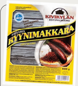
PALVARIN RYYNIMAKKARA 400 G