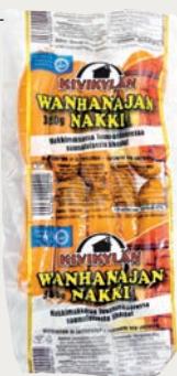
WANHANAJAN NAKKI 380 G