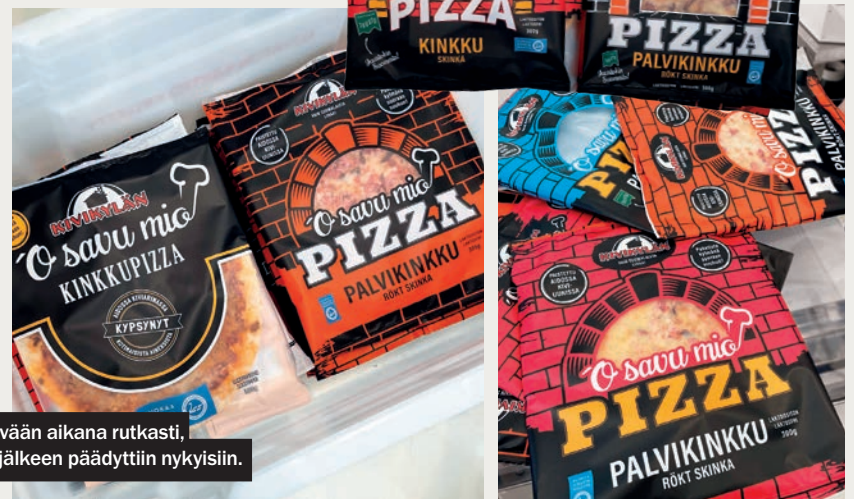
Erlaisia pakettimalleja tehtiin kevään aikana rutkasti, ennen kuin hyllytestausten yms. jälkeen päädyttiin nykyisiin.

PIZZOJEN MAAILMA ON KILPAILTU, MUTTA KOTIMAISUUDELLA ON RIVISSÄ PAIKKANSÄ.